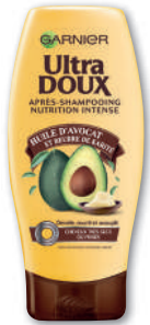
APRÈS-SHAMPOING AVOCAT 200ML ULTRA DOUX