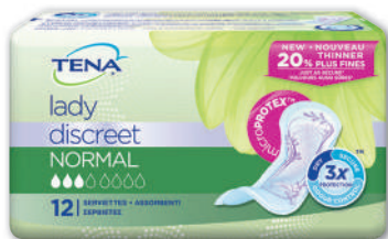
SERVIETTES LADY DISCREET NORMAL X 12 TENA