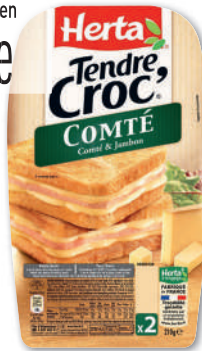
TENDRE CROC' COMTE ET JAMBON HERTA 210 g