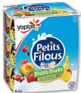
PETITS FILOUS FRUITS MIXÉS PANACHES YOPLAIT 18 x 50 g - soit 900 g