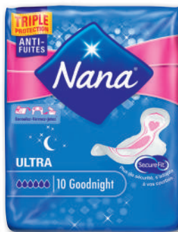
PROTEGE LINGERIE EXTRA LONGX24 SERV.ULTRA GOODNIGHT NANA