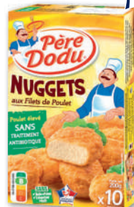
NUGGETS AUX FILETS DE POULET PÈRE DODU x10 environ - soit 200 g