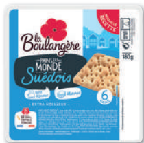
PAINS DU MONDE SUÉDOIS LA BOULANGÈRE 6x30g - soit 180 g