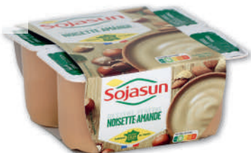
DESSERT VÉGÉTAL AU SOJA NOISETTE-AMANDE SOJASUN 4 x 100 g - soit 400 g