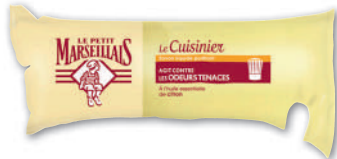
SAVON CUISINIER CITRON LE PETIT MARSEILLAIS 250 ml

Suggestions de présentation. (b) Dangereux, respecter les précautions d'emploi