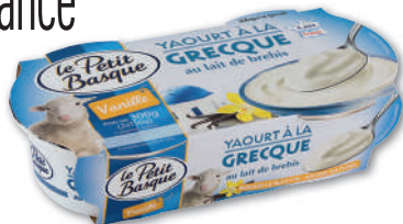
YAOURT À LA GRECQUE SAVEUR VANILLE LE PETIT BASQUE 2 x 150 g - soit 300 g