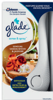
DIFFUSEUR SENSE & SPRAY SENSUALWOOD & JASMINE GLADE (B)