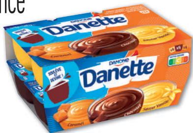
CRÈME CHOCOLAT/VANILLE/CARAMEL DANETTE 12 x 115 g - soit 1,38 kg