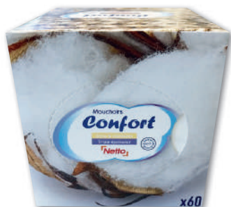
BOÎTE MOUCHOIRS CUBIQUE CONFORT TRIPLE ÉPAISSEUR X60 NETTO