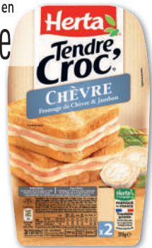
TENDRE CROC CHÈVRE HERTA 210 g