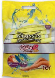
RASOIRS BEAUTY X10 WILKINSON