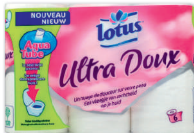
PAPIER HYGIÉNIQUE ULTRA DOUX X6 LOTUS