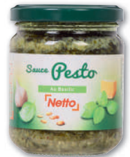
SAUCE PESTO AU BASILIC NETTO 190 g