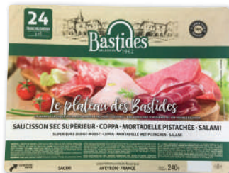
PLATEAU DES BASTIDES ASSORTIMENT DE CHARCUTERIE (SAUCISSON SEC, COPPA, MORTADELLE PISTACHÉE, SALAMI) BASTIDES 240 g