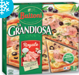
LA GRANDIOSA PIZZA ROYALE SURGELÉE BUITONI 570 g