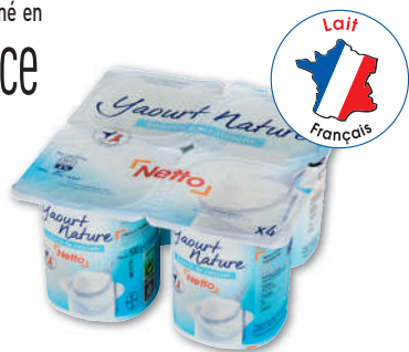
YAOURT NATURE NETTO 4 x 125 g - soit 500 g