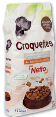
CROQUETTES POUR GRAND CHIEN AU BOEUF & À LA VOLAILLE NETTO >30kg 15 kg