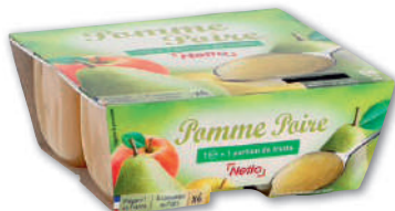
DESSERT DE FRUIT POMME POIRE NETTO 4 x 100g - soit 400 g