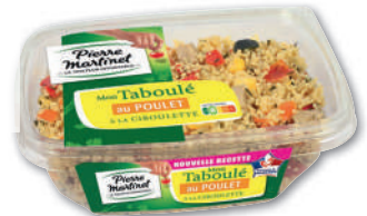
TABOULÉ POULET PIERRE MARTINET 510 g