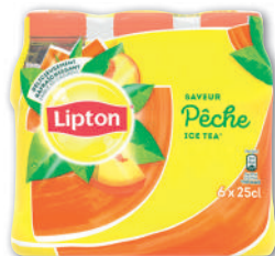
BOISSON AU THÉ PÊCHE LIPTON 6x25cl - soit 1,5 l