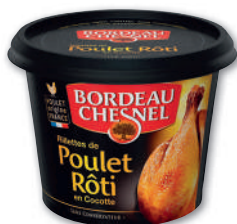
RILLETTES DE POULET RÔTI BORDEAU CHESNEL 220 g