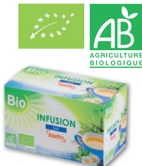
INFUSION DU SOIR BIO NETTO 30 g