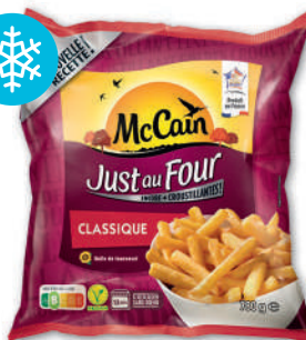
JUST AU FOUR CLASSIQUE SURGELÉES MC CAIN 780 g

POUR VOTRE SANTÉ, MANGEZ AU MOINS CINQ FRUITS ET LÉGUMES PAR JOUR. WWW.MANGERBOUGER.FR Suggestions de présentation.