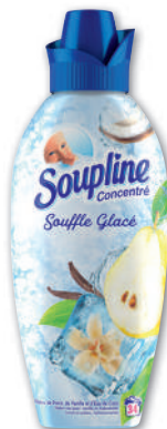
ADOUCCISSANT CONCENTRÉ SOUFFLE POIRE VANILLE (B) SOUPLINE 800 ml