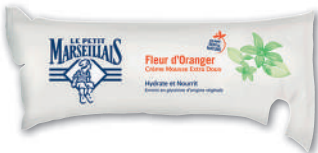
GEL DOUCHE EXTRA DOUX FLEUR D'ORANGER LE PETIT MARSEILLAIS 250 ml