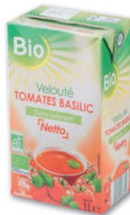
VELOUTÉ LÉGUMES VARIÉS BIO NETTO 1 l