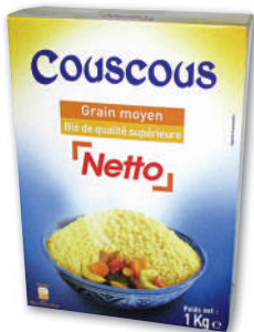
COUSCOUS GRAIN MOYEN NETTO 1 kg