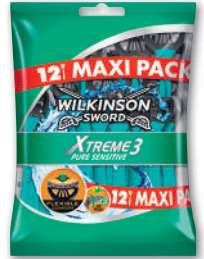
RASOIRS JETABLES XTREME 3 PURE SENSITIVE X12 WILKINSON