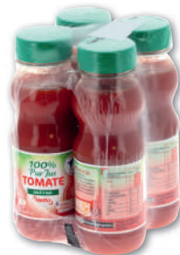
PUR JUS DE TOMATE NETTO 4x20CL 80 cl