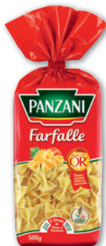
PÂTES FARFALLE PANZANI 500 g