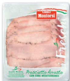
I FRESCHI JAMBON CUIT RÔTI AUX HERBES MONTORSI 120 g