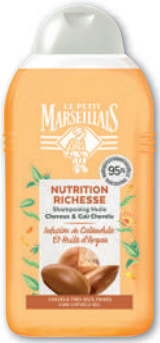
SHAMPOING INFUSION NUTRITION LE PETIT MARSEILLAIS 250 ml