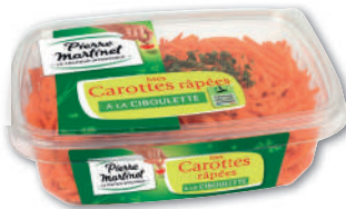
MES CAROTTES RÂPÉES PIERRE MARTINET 510 g