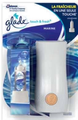
DIFFUSEUR DESIGN TOUCH & FRESH MARINE (B) GLADE