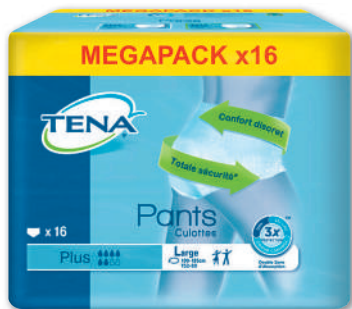
PANTS PLUS LARGE TENA