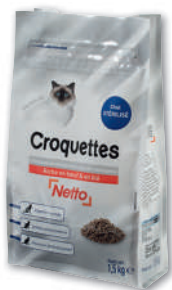
CROQUETTES POUR CHAT STÉRILISÉ AU BOEUF NETTO 1,5 kg