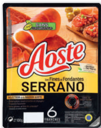
JAMBON CRU LES FINES ET FONDANTES SERRANO AOSTE 6 tranches - soit 100 g